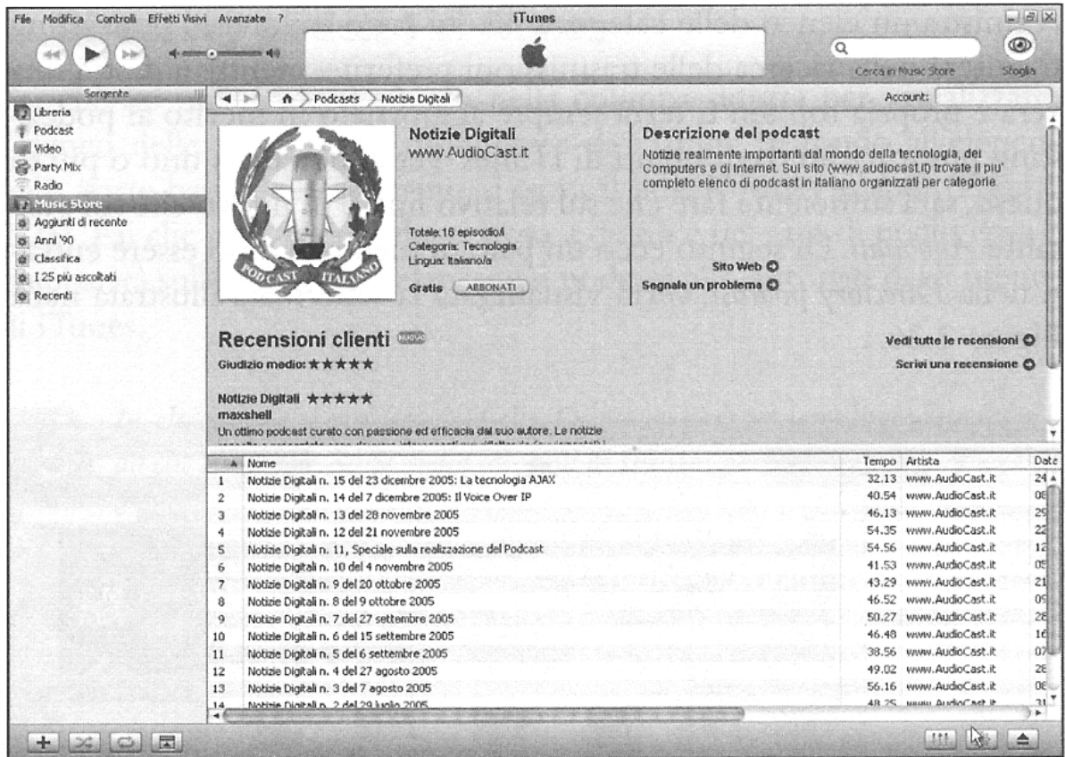
Figura 2.27 Il podcasting Notizie Digitali .

La schermata riporta, come si può ben notare, il titolo del podcasting, un'illustrazione, una breve descrizione e l'elenco delle trasmissioni disponibili. Leggermente a destra rispetto all'illustrazione c'è il pulsante Abbonati . Fai clic sopra con il pulsante sinistro del mouse e vedrai comparire immediatamente l'elenco dei podcast preferiti. Tra di essi c'è, appunto, Notizie Digitali .